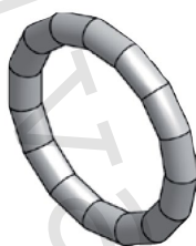
Těsnicí O-kroužek LBP